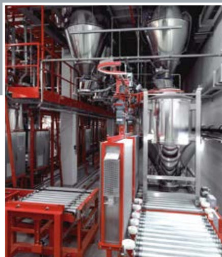
Containerbefüllung mit KAD – KOKEISL