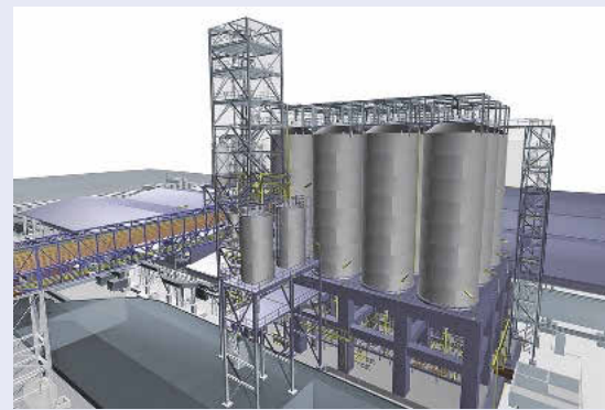
3-D-Technologie führt zu besseren Ergebnissen bei der Anlagenauslegung

welche Komponenten der Altanlage verbleiben, verändert oder im Zuge der Modernisierung demontiert werden dürfen. Auch bei Zielkonflikten in der Planung oder bei Kollisionen/Clashes kann man sachkundig entscheiden, welche Bauteile Priorität haben und wie sich die Situation bestmöglich lösen lässt. Über diese 3-D-Modellierung des Stahlbaus, sämtlicher Komponenten und Rohrleitungen können Optimierungen der Anlage unter Aspekten wie Zugänglichkeit für Wartung und Service oder optimale Raumnutzung schnell und zuverlässig erarbeitet werden. Der Umbau einer Anlage kann somit präzise geplant und mit geringer Produktionsunterbrechung und hoher Sicherheit durchgeführt werden.