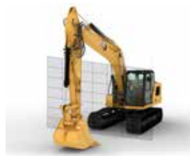
E-WALL CAB PROTECTION