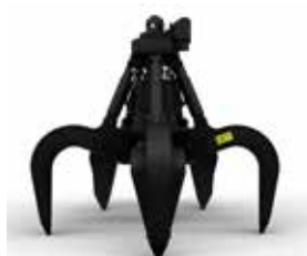
GSV – MEHRSCHELENGREIFER