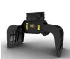
ABBRUCH- UND SORTIERGREIFER