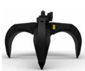
GSH – MEHRSCHELENGREIFER

Passen Sie Ihre Maschine an den Auftrag an. Die MH3022 bietet elf Ausleger- und Stielkombinationen, bei der MH3024 sind es acht. Die Ausleger- und Stieloptionen sowie die verschiedenen Laufwerkskonfigurationen ermöglichen Ihnen eine Anpassung Ihrer Maschine an die Anforderungen Ihres Einsatzbereiches.